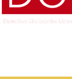
Élaboration CADO/Charles LEBLANC

Représentations : - Samedi 26 mai à 16h - Dimanche 27 mai à 16h - Samedi 2 juin à 16h - Dimanche 3 juin à 16h - Vendredi 8 juin à 16h - Samedi 9 juin à 16h