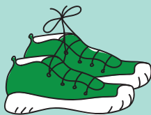
Chaussures liées par paire

TOUS LES TEXTILES PROPRES ET SECS même abîmés.