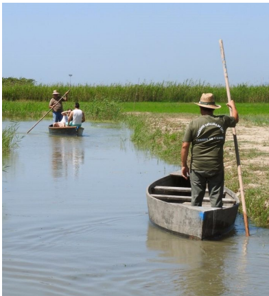
Barquet de perxar (Espagne)