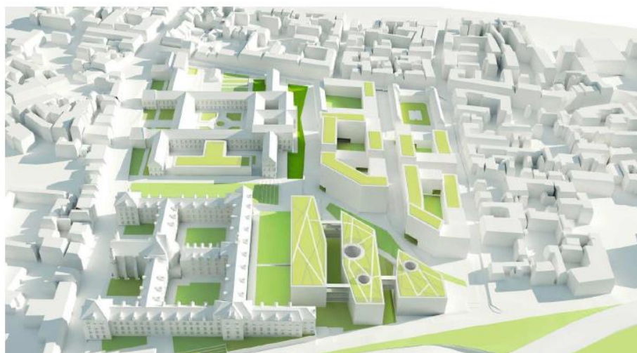
Plan de composition du futur site Porte Madeleine

A terme, 6 000 élèves sont attendus dans le centre-ville, venant renforcer le Campus de La Source.