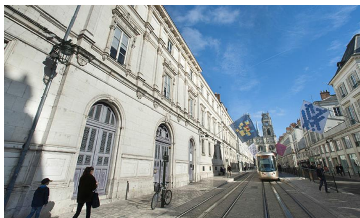
Ancien Collège Anatole Bailly – Rue Jeanne d'Arc

L'arrivée de ces écoles est un véritable atout pour Orléans Métropole, à la fois pour soutenir l'offre de formation actuelle de l'Université, dynamiser le centre-ville , développer la vie étudiante et réduire le fort taux de fuite des bacheliers vers d'autres villes étudiantes. De plus, pour soutenir la compétitivité des acteurs économiques de la métropole , conformément au besoin exprimé en recrutement de cadres en gestion, marketing ou ingénierie, ces écoles créeront un vivier local d'étudiants spécialisés dans ces domaines et fluidifieront ainsi les embauches.